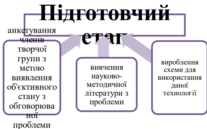
Схема роботи творчої групи