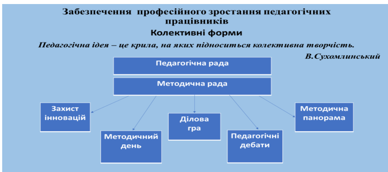
Слайд 12 – Колективні форми

Слайд 11 - Забезпечення професійного зростання педагогічних працівників: Колективні форми